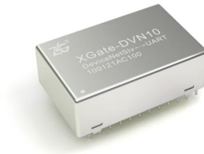
图 1.1 XGate-DVN10 外观图